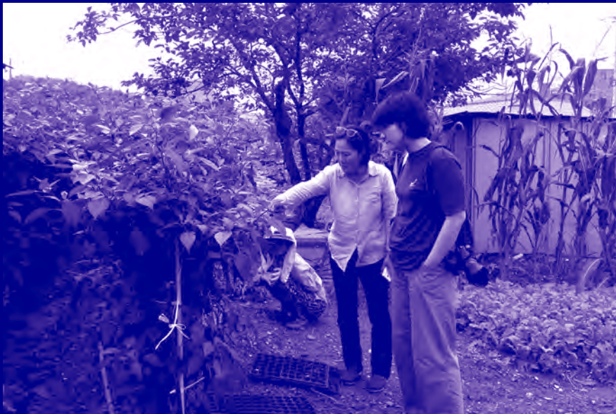
〈대부도 오래된집 프로젝트〉 Daebu Island Old House Project

—— The kick-ball event invites local community members, GCC artists and employees to come together and further understand one another. Also, the event is designed to promote GCC's activities and roles.