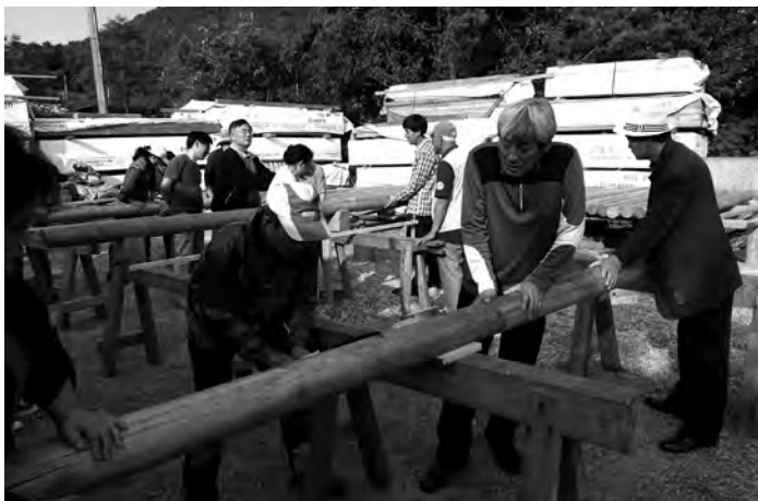
〈열린 창작 공방학교〉 Open Creativity Workshop