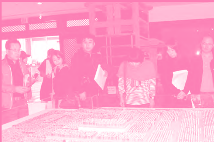
입주작가 워크샵 - 해인아트프로젝트 관람 Workshop with resident artists - Haerin Art Project Tour

GCC believes that residency based international interaction offers a wide range of cultural communication and exchange of artistic ideas, which is impossible in short-term visits for exhibitions and projects. Since its opening in 2009, GCC has hosted a number of major international events such as special exhibition Multicultural in Our Time in collaboration with Le Pavillon in Paris, Res Artis Conference, with partnership between international organisations such as Korea-Arab Society and the Africa Center, GCC has been inviting exchange artists. GCC continues to discover mutually beneficial opportunities such as artist exchange visits, and develop our program as one with a significant and sustainable purpose through Japan, Australia, New Caledonia, United Arab Emirates and Spain in the near future.