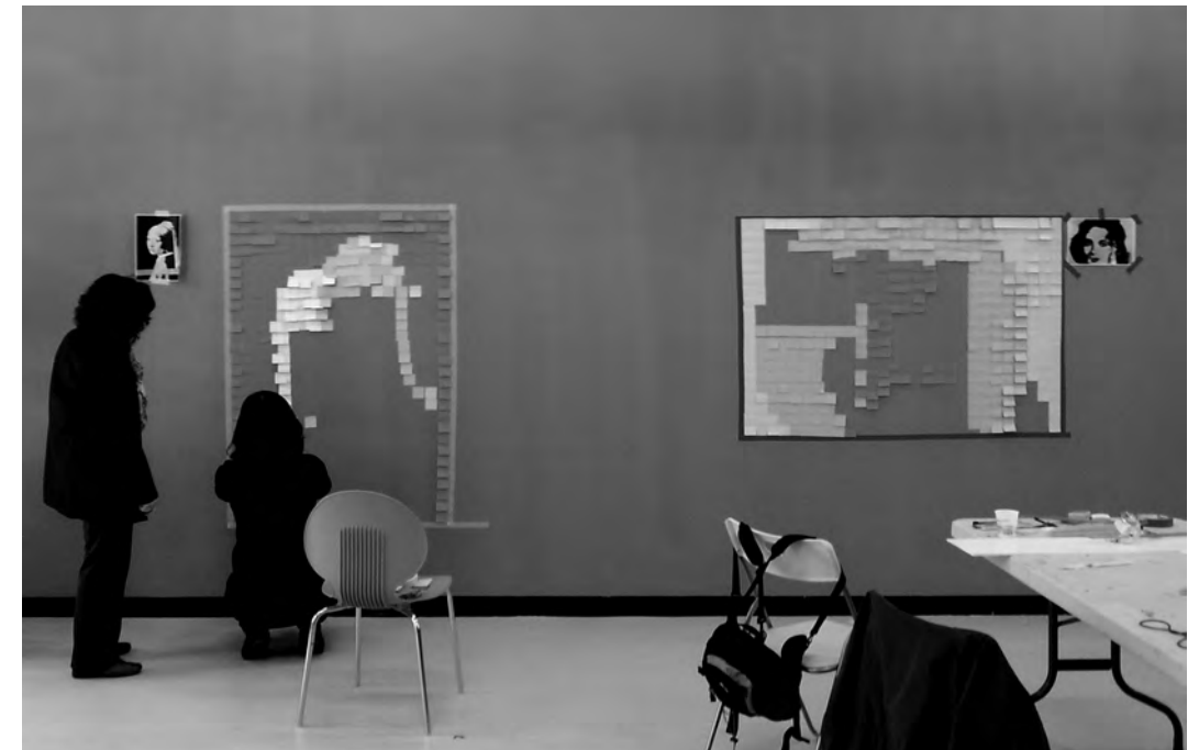
예술로 차차차 Art Chal Chal Chal