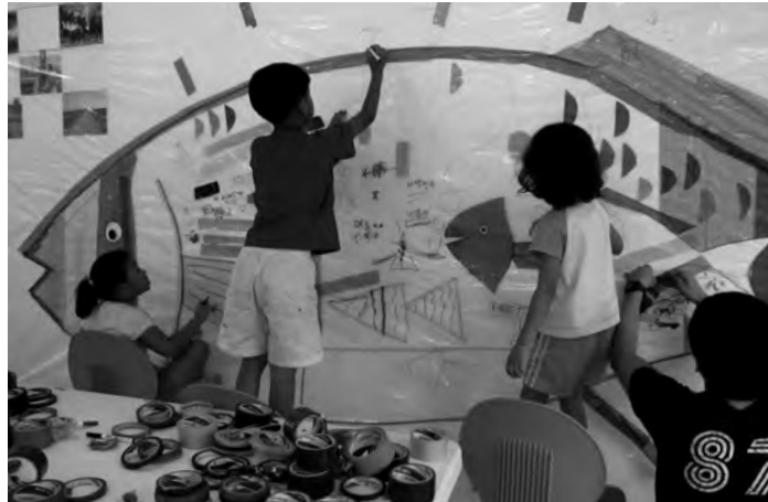
〈섬에서 예술에 빠지다! 상상풍당!〉 Artistic Immersion on an Island! Jump into Imagination!

경기창작센터에서는 상상력과 창의력이 가장 극명하게 발휘되는 “예술”이라는 분야를 모티브로 다양한 창의예술 교육 프로그램을 진행하고 있습니다. 특히 경기창작센터 입주작가의 작업과 연계한 체험교육으로 보다 생생하고 구체적인 프로세스를 경험할 수 있습니다. 또한 대상별·상황별에 따른 맞춤형으로 ‘전시감상+작가강연+예술체험+단체마당’이 어우러지는 통합형 교육을 제공합니다. 이를 통해 내 안에 숨겨진 창의적 사고와 예술적 감성을 찾아보고, 그동안 낯설게 느껴진 예술에 쉽고 재미있게 다가가는 계기가 될 것입니다.