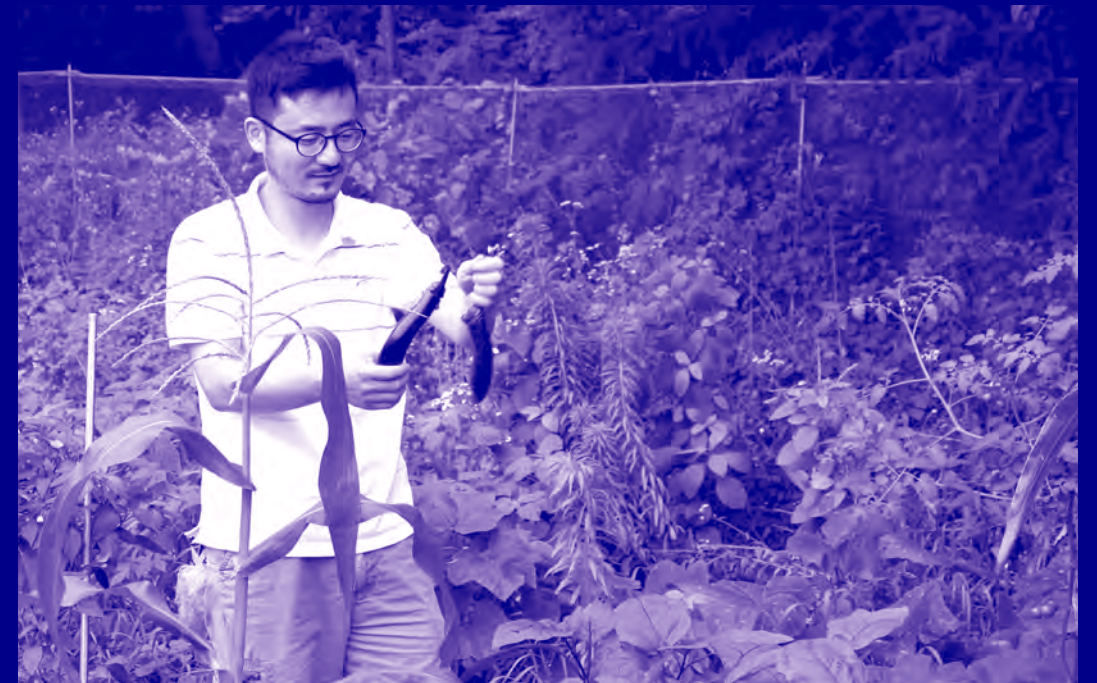
·아트농장· Art Farm GCC