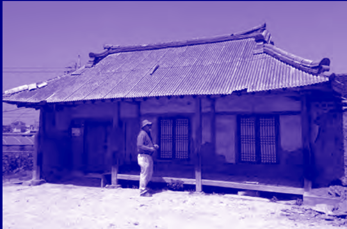
〈대부도 오래된집 프로젝트〉 Daebu Island Old House Project

2013년 경기창작센터 지역디자인 사업은 입주작가와 직원들의 커뮤니티 조성을 위한 프로젝트와 더불어 대부도 지역을 중심으로 주민들과 소통하여 예술에 대한 주민들의 인식을 변화할 수 있게 하기 위한 활동에 초점을 맞추어 진행하였습니다. 이는 경기창작센터 설립이후 4년간 진행해온 지역협력 사업을 되돌아보고, 경기창작센터 지역디자인 사업의 방향을 고민하는 시간이기도 하였습니다. 또한 지역의 범위를 보다 확장하여 지자체와 협력하여 경기도 일대 환경개선 및 디자인을 진행한 시이기도 합니다.