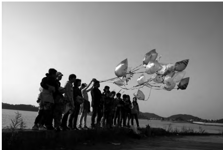
〈섬에서 예술에 빠지다! 상상풍당!〉 Artistic Immersion on an Island! Jump into Imagination!

Youth and teen-focused programs include the school collaboration camps, two-day weekend family camp, and teen creative residency camp. The school collaboration camp is offered throughout the year, and aims to develop the creative potential of students in classes, interest groups, and other organizations. The two-day weekend family camp takes place on weekends throughout May~November. The participants spend a meaningful weekend with their family, away from their usual routine, sharing and volunteering for the local communities and experiencing various art and local culture activities. The teen creative residency camp is held over four nights and five days during winter and summer vacations. The camp offers an opportunity to experience creative processes as resident artists from crafts work to exhibition, combining "career exploration and creative work" for aspiring future artists.