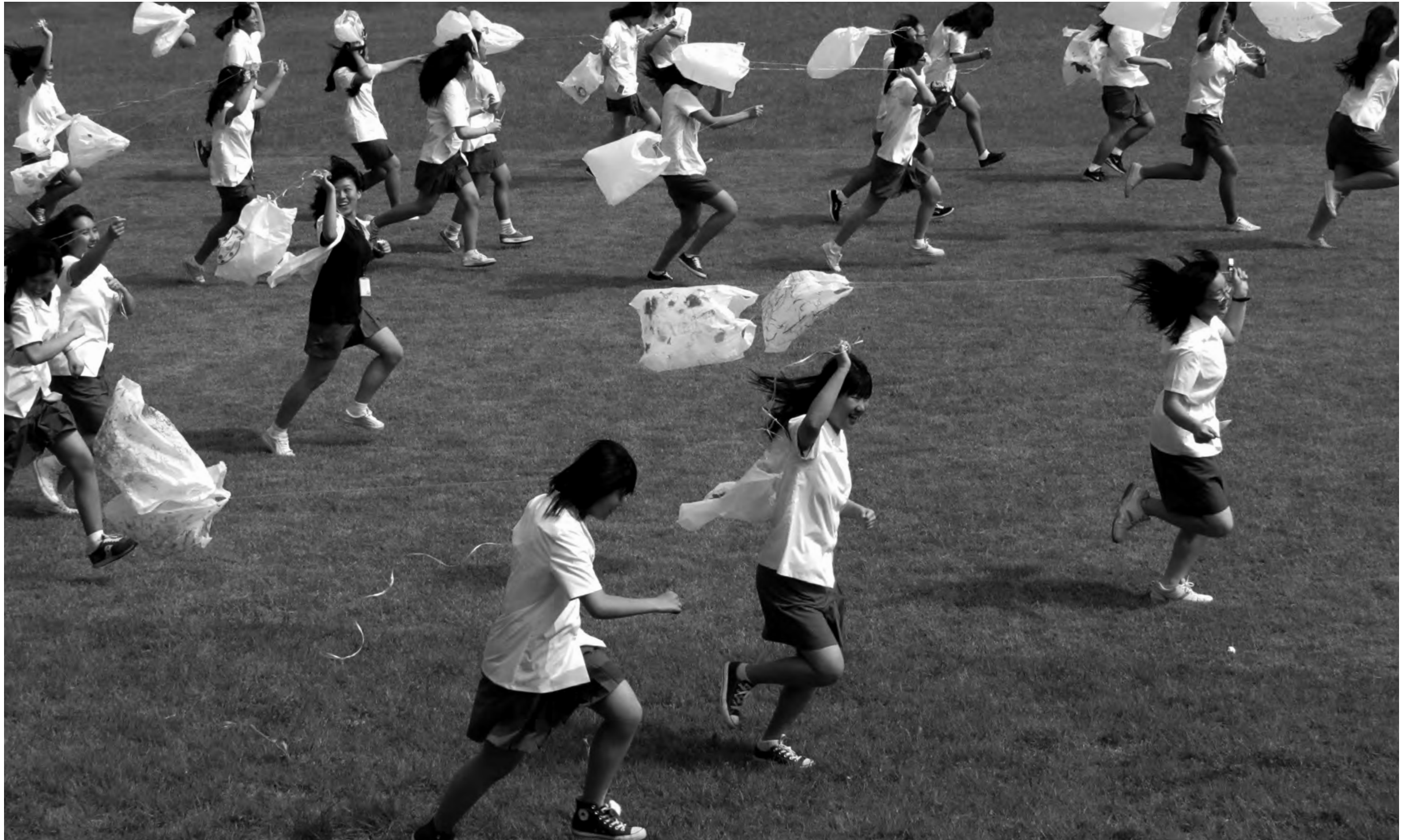
〈섬에서 예술에 빠지다! 상상풍당〉 Artistic Immersion on an Island! Jump into Imagination!