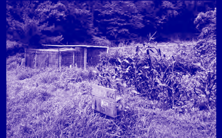
·아트농장· Art Farm GCC