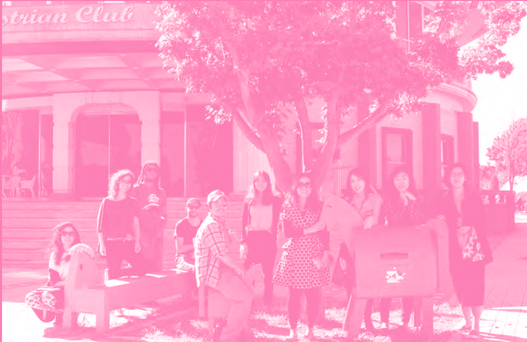
해외입주작가 워크샵 - 대부도투어 Workshop with International artists - Dabudo Tour