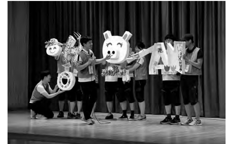
예술로 차차차 Art Chal Chal Chal