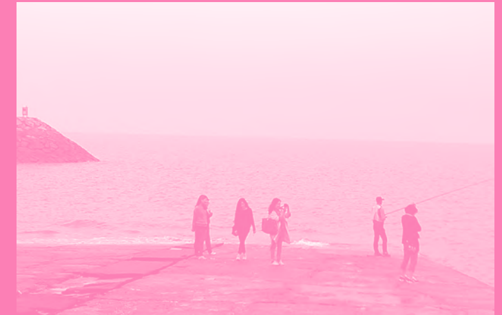
입주작가 워크샵 Workshop with resident artists

The exhibition program consists of open studio event and special exhibitions. Open studio is mandatory for creative residency artists as a form of a report exhibition at the end of their residency period. Special exhibitions supports presentation spaces for the resident artists' creative work such as solo or group