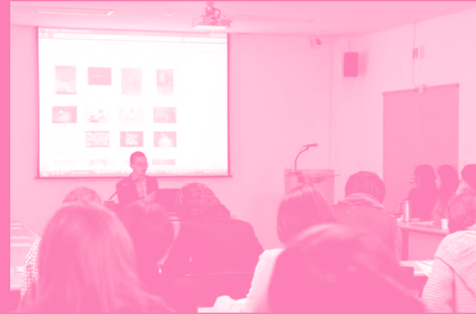
입주작가 프레젠테이션 Presentation by resident artists