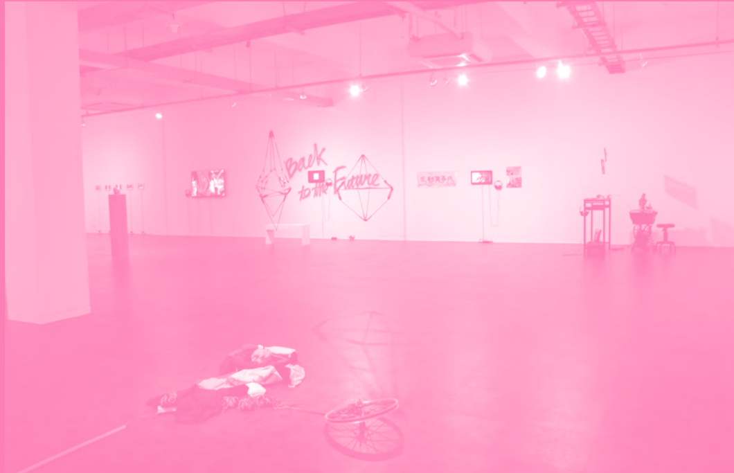
2013 입주작가 쇼케이스 전시 설치전경, 경기창작센터 What's on Installation view